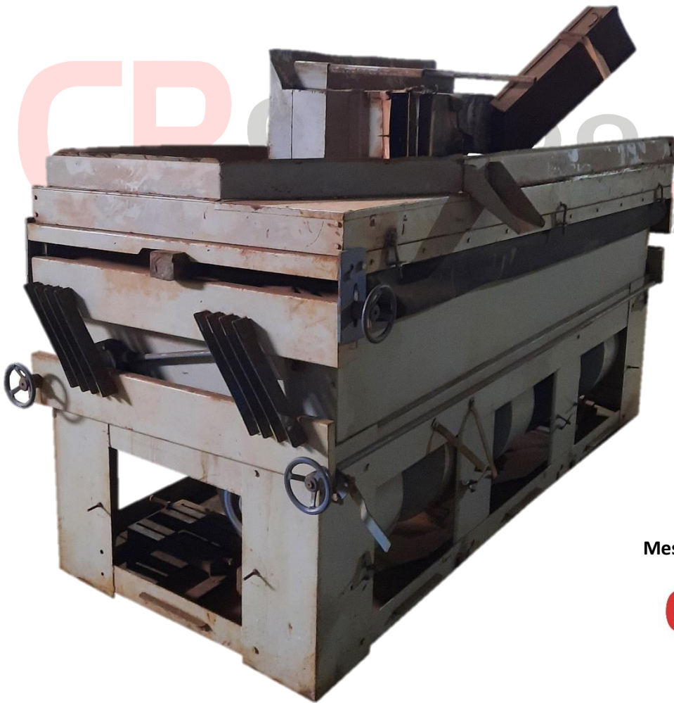
Mesa Dencimétrica Campo Real Usada de 75 Sacos/H - CPR 75