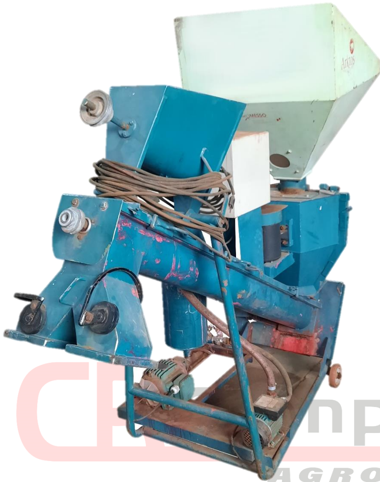
Tratador de Sementes Usado Momesso