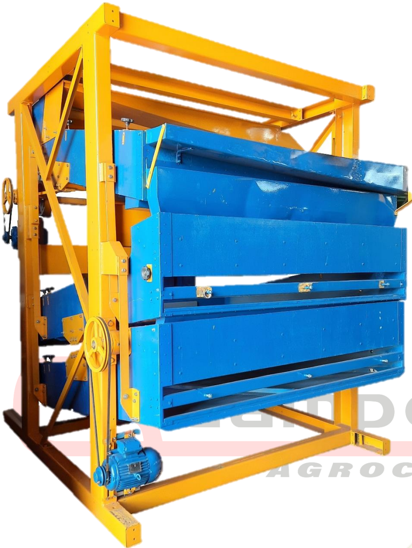
Pré Limpeza Renk Reformada de 120 Ton/H - LS120