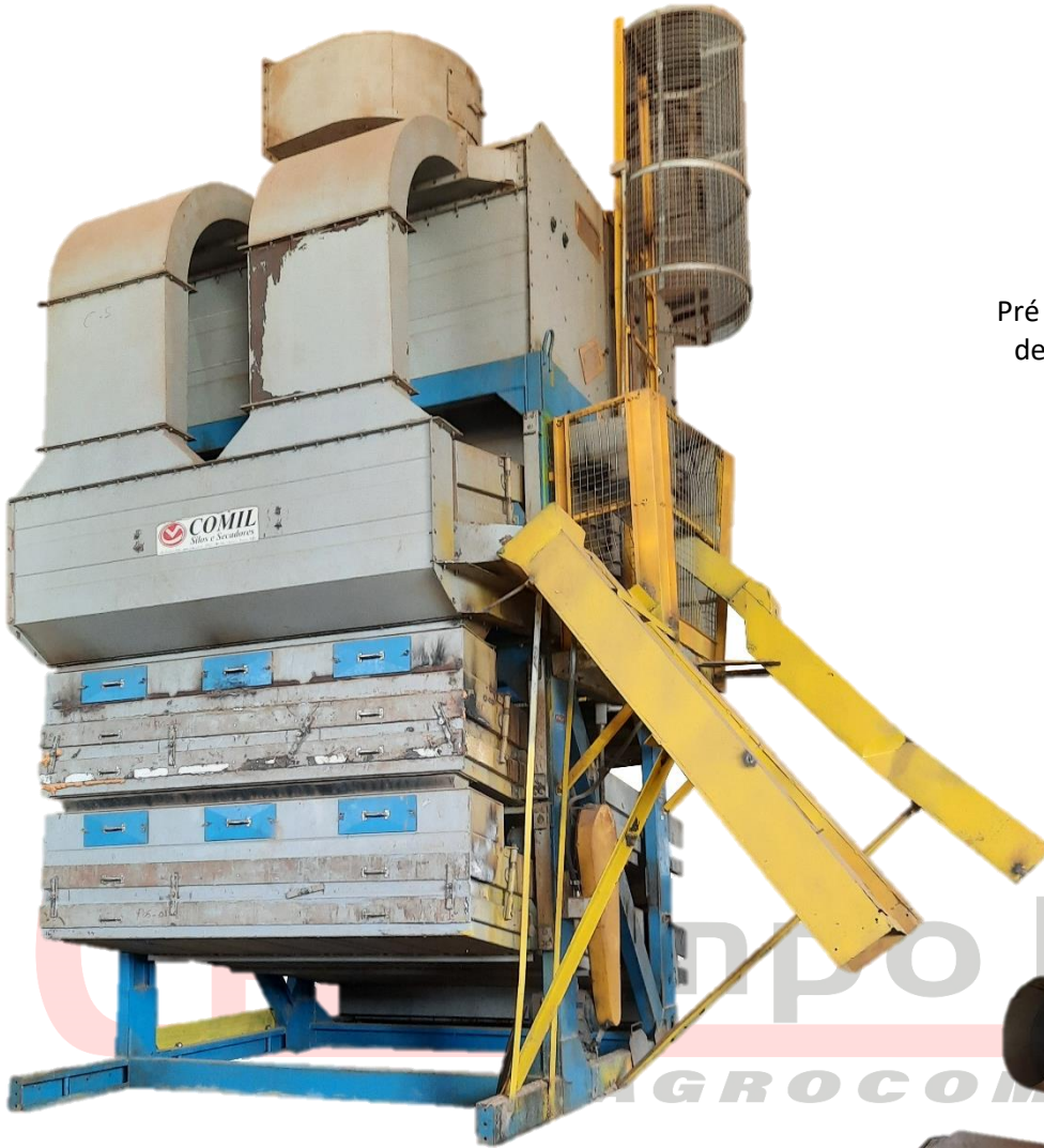
Pré Limpeza Comil Usada de 120 Ton/H - ML120