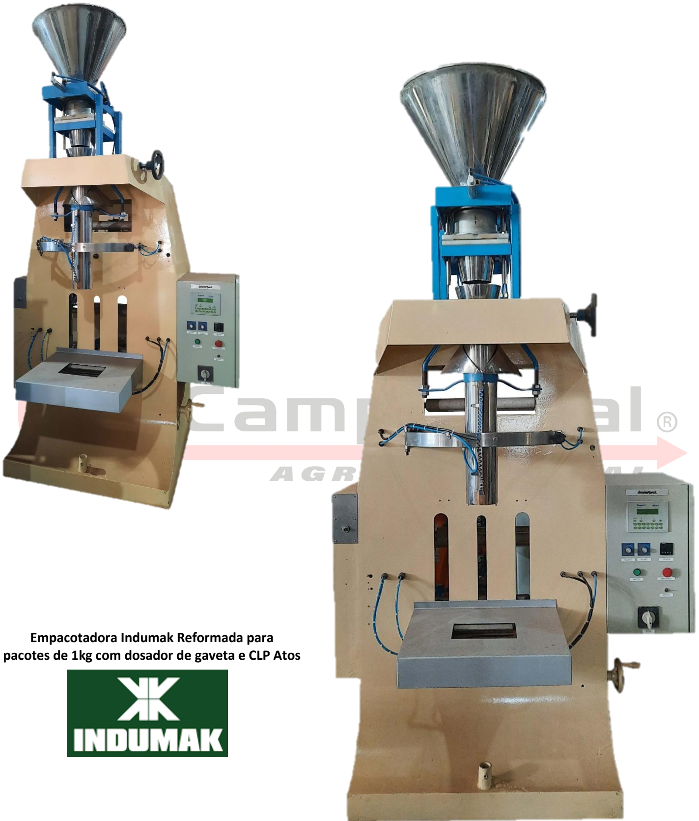
Empacotadora Indumak Reformada para pacotes de 1kg com dosador de gaveta e CLP Atos