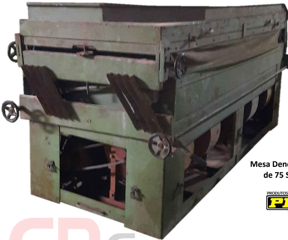
Mesa Dencimétrica Pinhal Usada de 75 Sacos/H - MP OL 75